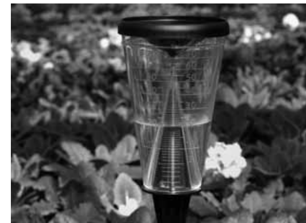
Kat. Nr. 47.1008