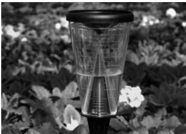
Kat. Nr. 47.1008